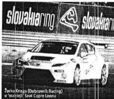
Žarko Knego (Dubrovnik Racing) u 'mekinji' Seat Cupre Leonu

Više od tridesetak hrvatskih vozača vozilo je proteklog vikenda na Slovačka Ringu, stazi čiji je krug 5923 metra dug sa 14 zavoja, i koji je izgrađen prije 11 godina. Sjajno zdanje, 40 kilometara od Bratislave, ugostilo je u su-